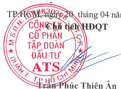
Trần Phúc Thiên Ân