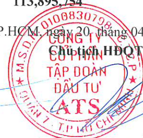
Trần Trúc Thiên Ân